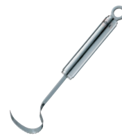
⑯ レズレー うろこ取り ㊦