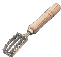
① 真鍮 ウロコ取り