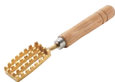
② 真鍮 うろこ取り