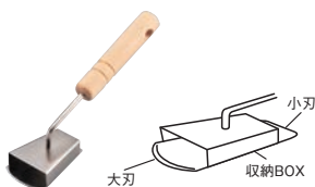
⑤ 飛び散らないウロコ取り