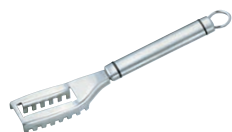
⑩ 18-8 うろこ取り (9981-518) ㊦