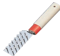
⑧ 丸石 ウロコ取り