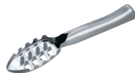
⑨ うろこ取り(カバー付) ㊦