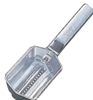
⑮ ウエストマーク スケールスキナー (ウロコ取) ㊦