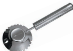
⑪ 18-8 うろこ取り 銀鱗 ㊦